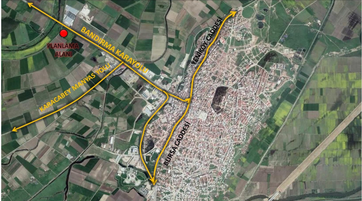
Şekil 1. Uydu Görüntüsü 1

Plan talebine konu taşınmaz; Bursa İli, Karacabey İlçesi, Hotanlı Mahallesi sınırlarında, Bandırma Karayolunun güneyinde ve Karayoluna cepheli, Karacabey ilçe merkezine 2.5 km uzaklıktadır.